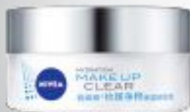
妮维雅®「卸妆大白罐」